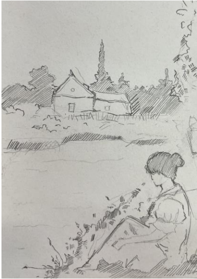
Тимченко Максим, 15 лет