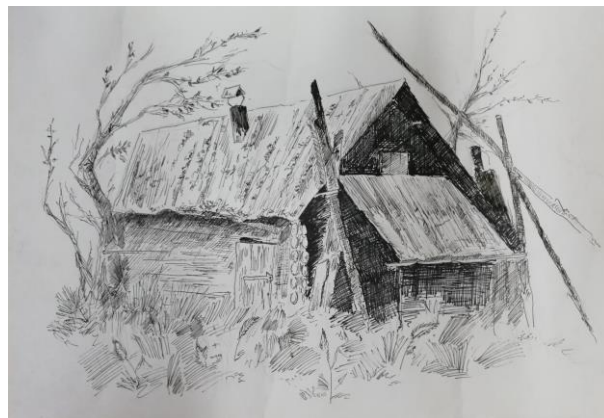
Тимченко Максим, 14 лет