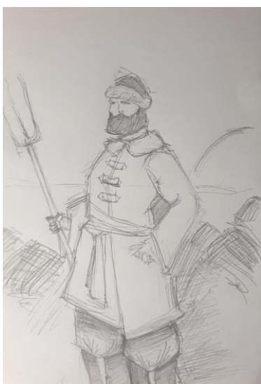
Тимченко Максим, 14 лет